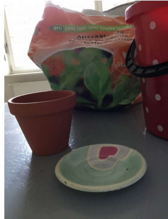
1 Eimer+1 Blumentopf+1Teller