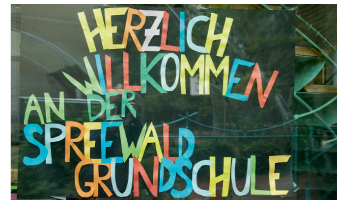
Spreewald-Grundschule Pallasstraße 15, 10781 Berlin, Tel. 030 90277 7151