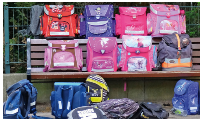
Neumark-Grundschule Steinmetzstraße 46-50, 10783 Berlin, Tel. 030 90277 7163